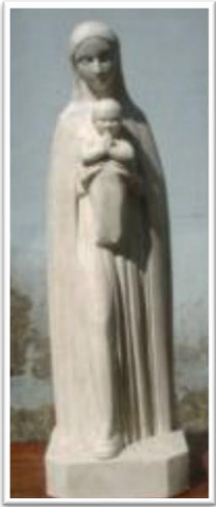
N. D. des Roches, Présidente, depuis le Ciel